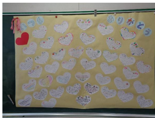
お手紙を貼りました。

給食をいただけることは、「当たり前」ではありません。いきものの命と、飼育・生産の方と、運搬の方と、調理の方、他にも大勢の方のおかげです。