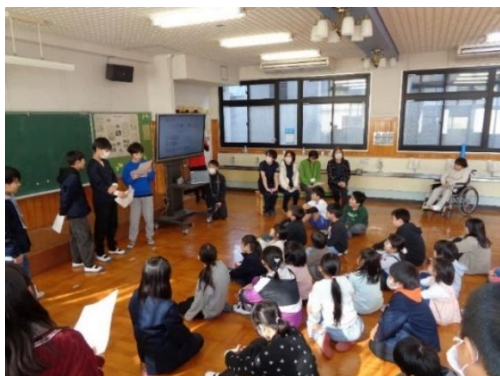
クイズをしたり、お手紙を渡したりしました。