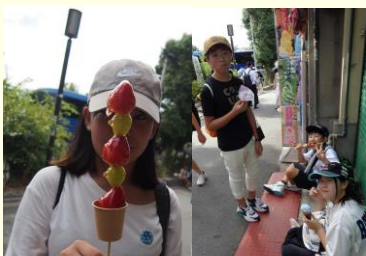
さんねいざか た ある 産寧坂で食べ歩き