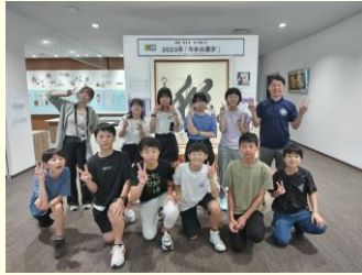
かんじ きよねん かんじ ごうかくしやう 漢字ミュージアム(去年の漢字と合格証)