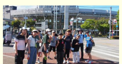
つぎ たいけん ま となり こうこうやきゅう せいち こうしえん 隣の高校野球の聖地甲子園