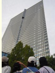
おおつ 大津プリンスホテル (見上げる高さ