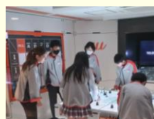
つく さいがい そうい でんば きち つく