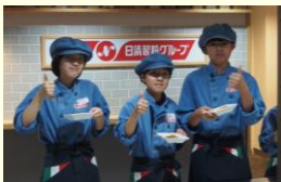
キッズニア しょくぎやうたいけん