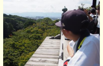
きよみずでら ふたい きやうとしない なが 清水寺の舞台から京都市内を眺める