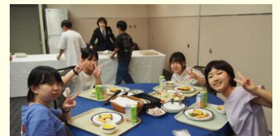
いちぼう しょくじ たび おも て 食事も旅の思い出