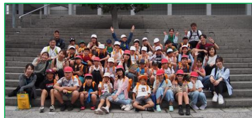
びわこホール前大階段で集合写真です。

5月17日に、多賀町健康づくり推進協議会主催のイベント「いきいきライフ体験塾」が開催され、私(校長)も参加しました。「血圧測定」「減塩具だくさん味噌汁」「脳年齢や骨密度の測定」などを体験しました。これらは、多賀町が『高血圧ゼロのまち宣言』をし、日本高血圧学会に承認されたことに関連した取組です。