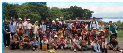
琵琶湖博物館中庭で全員集合です。

びわ湖ホール音楽会へ出かけよう! (ホールの子事業)で検索してください (中の写真撮影ができません)