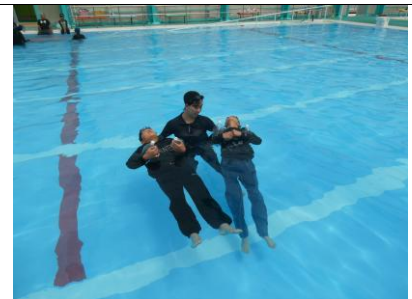
昨年の着衣泳の様子